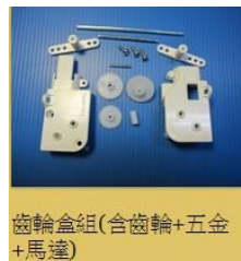
齒輪盒組(含齒輪+五金+馬達)